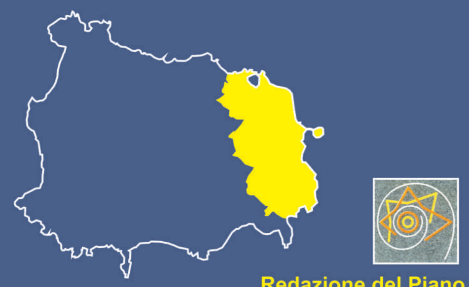
TAVOLA 13a1 - ZONA PORTO Schema rete adduzione e serbatoi

Programma Operativo Complementare 2014-2020 D.G.R. n° 665 del 29/11/2016 DD Dg5009 n° 74 del 30/8/2017 e s.m.c.